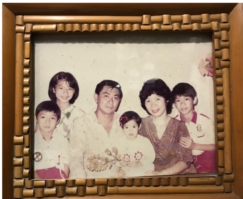
图一：上世纪90年代家庭照

某日，在手机上与老乡友聊及对子孙的教育问题，想像往昔自己对亲生子女的教育方式，不会多给他们设定指标，只须找到好学校，在学校报名，过后就尽可放心地让他们入校读书接受教育。但现在生活已不像从前那般单纯，以前没有电脑、智能手机，更没有所谓的瞬间能联通四海的互网络等先进媒介。现今孩子的课业负担和课外培训越来越多，孩子的烂漫童年可說已变得越来越遥不可及，中国大陆现时对孩子的教育极其注重及多方调整，2021年第三季度更为学童的“减压”开始实施了“双减”教学方针。而且，现在孩子的性格也随周围环境、媒体的影响变得更臻成熟，对新事物很感兴趣及有强烈的仿照臆想，对自身的个人意识有极强