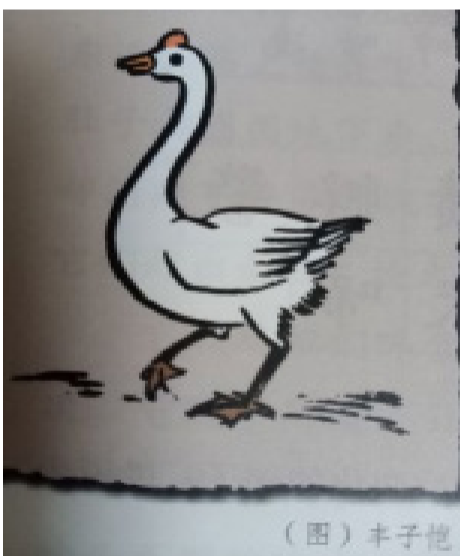
丰子恺先生画和散文《白鹅》