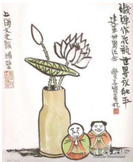
被批为“黑画”的一幅