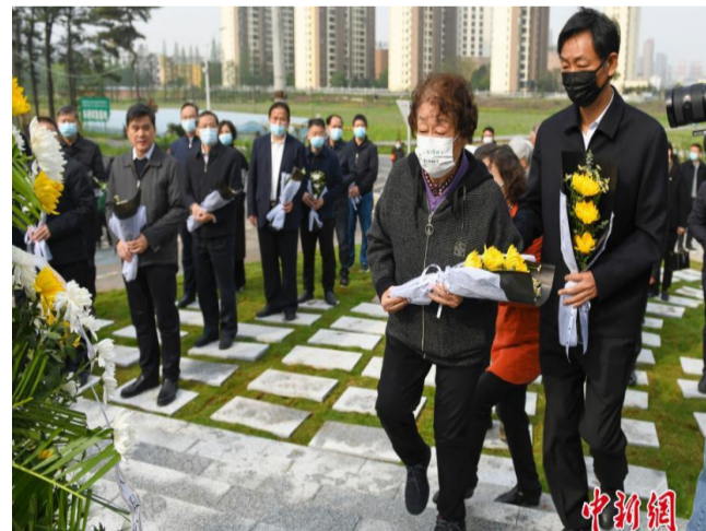
4月2日，湖南长沙，袁隆平铜像旁摆放着民众敬献的鲜花。当日，“杂交水稻之父”、中国工程院院士、“共和国勋章”获得者袁隆平铜像在湖南省农科院揭幕。中新社记者 杨华峰 摄