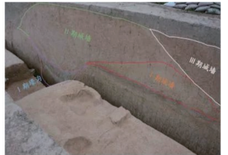
图四 北城墙-城壕的扩建过程(西南-东北)