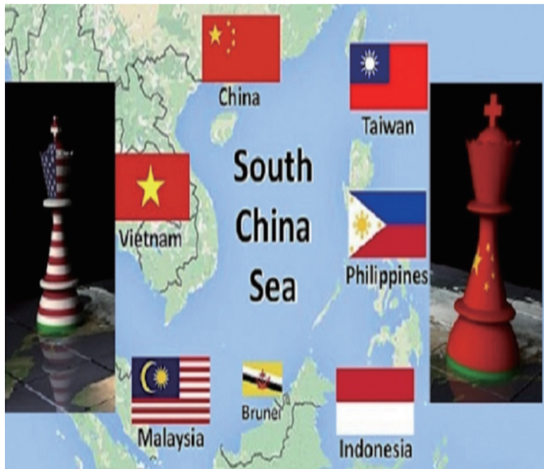
各国南中国海主权要求范围示意图