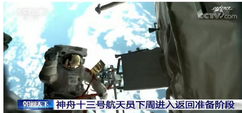
神舟十三号航天员下周进入返回准备阶段