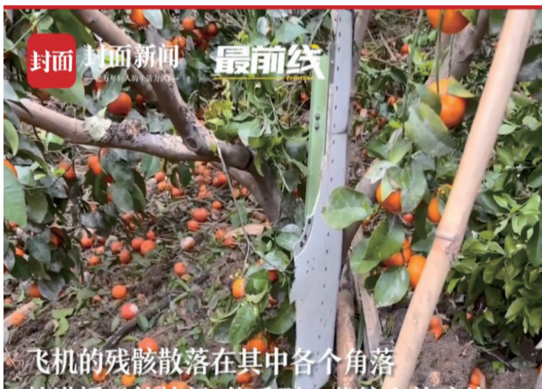
飞机的残骸散落在其中各个角落

这个钱包中，装有3月11日c772的一张高铁票，也许那趟车次曾带着钱包主人从南充去往广安南站。疫情期间还在数个省市之间穿梭，它的主人一定是努力生活的人。除了人民币，还能依稀看到钱包中装有外币，形似2000面值的越南盾，约合人民币5毛钱。