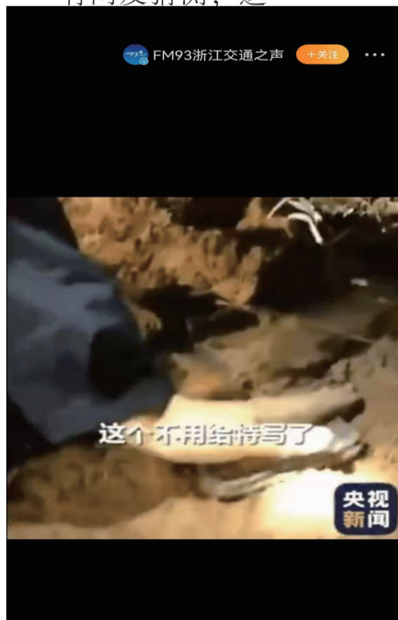
这个不用给特写了