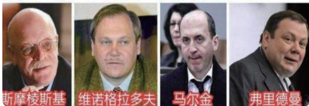
叶利钦时代的七大寡头