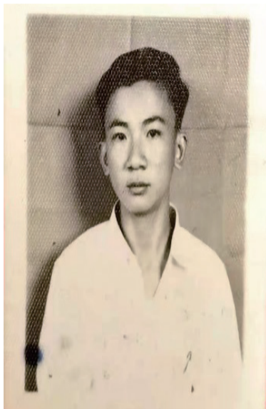
图1回国前夕 少年的我