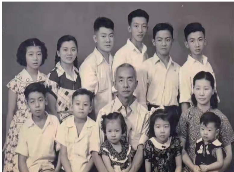
图2 举家回国后拍的全家福 (后排右1)