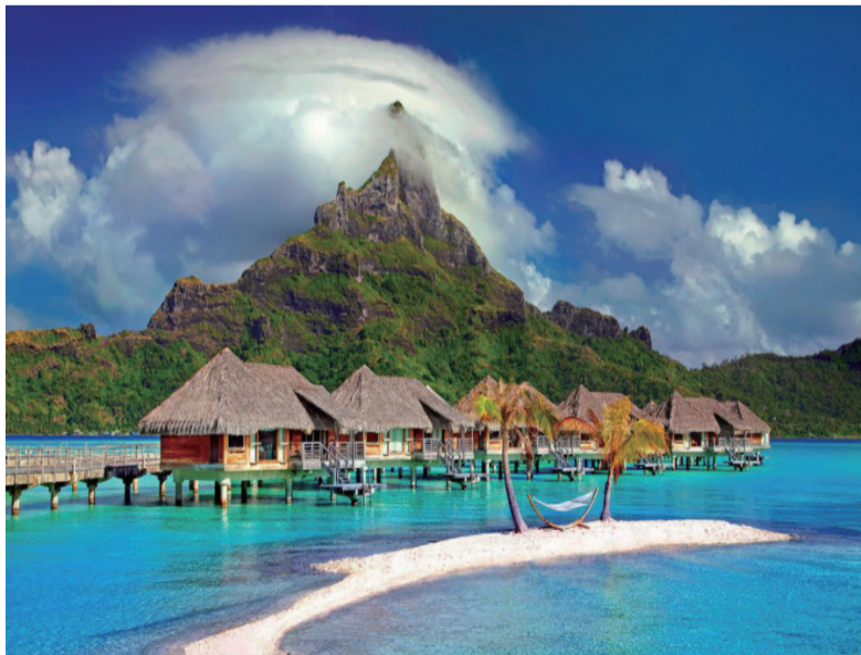
巴厘岛旅游景点蓝梦岛

后来父亲去世，重担又落在母亲身上，她每天一大早到村里附近割香蕉叶或其他农作物，用头顶着要走来回十公里路到城里（峇塘）去贩卖，靠此赚取小利养活一家。