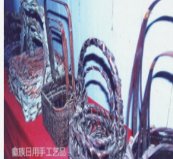
在这深山老林里，这农具和竹编用具，必不可少