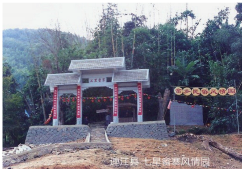
改革开放后建有民俗风情园