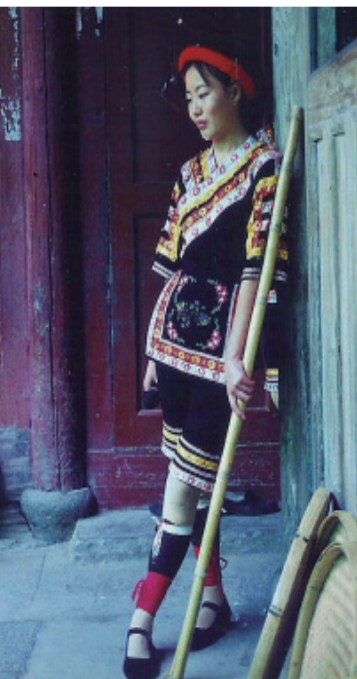
姊妹出嫁，当然有心思