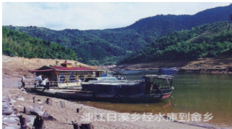
乘汽船到日溪畲族乡