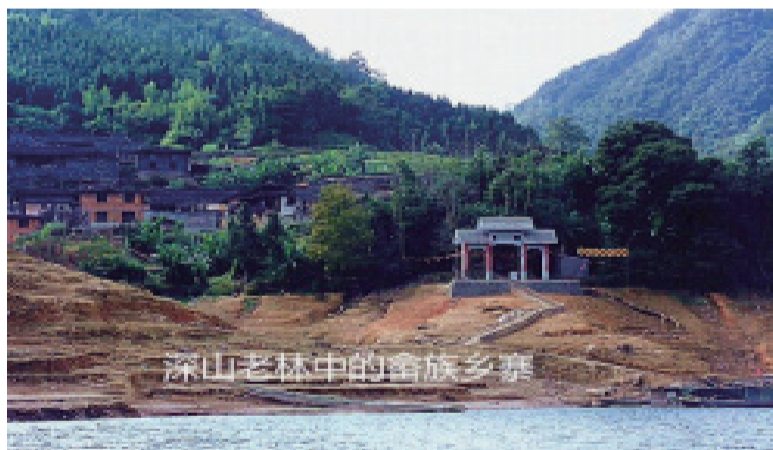
畲族乡地处深山老林