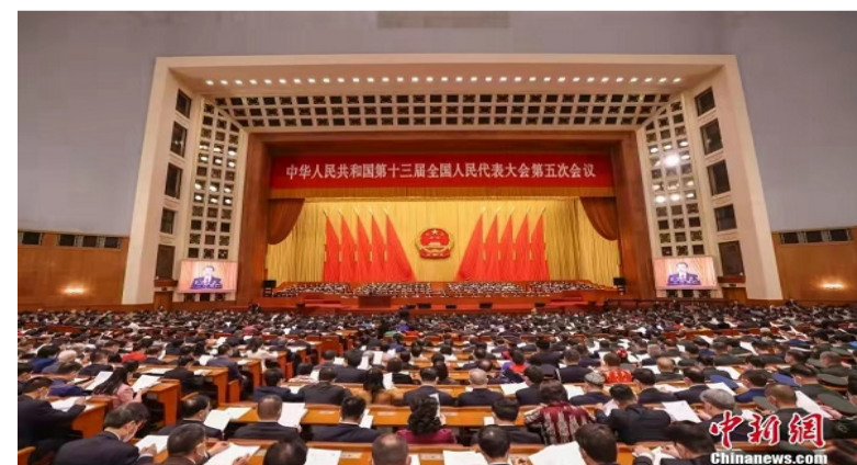
3月5日，十三届全国人大五次会议在北京人民大会堂开幕。

李明欢认为，侨务部门应继续及时、全面了解海外侨情动向，推动侨务工作更加紧密地贴合海外侨胞和归侨侨眷需求，助力广大侨胞在新挑战下，以新的奋斗之姿，创造新的辉煌。(完)