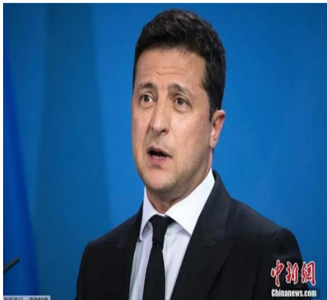
资料图：乌克兰总统泽连斯基。