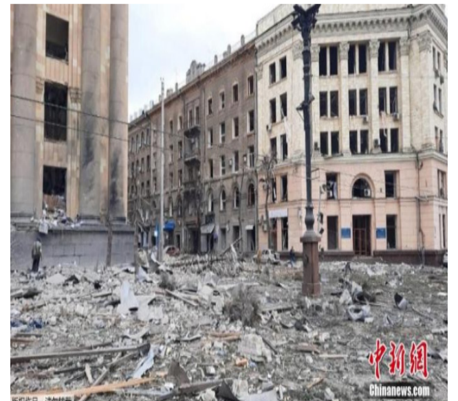
当地时间3月1日，乌克兰哈尔科夫市中心的政府大楼广场遭到炮击。