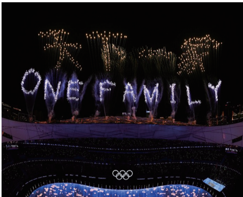
焰火在“鸟巢”上空显示出中文“天下一家”和英文“ONE FAMILY”字样。