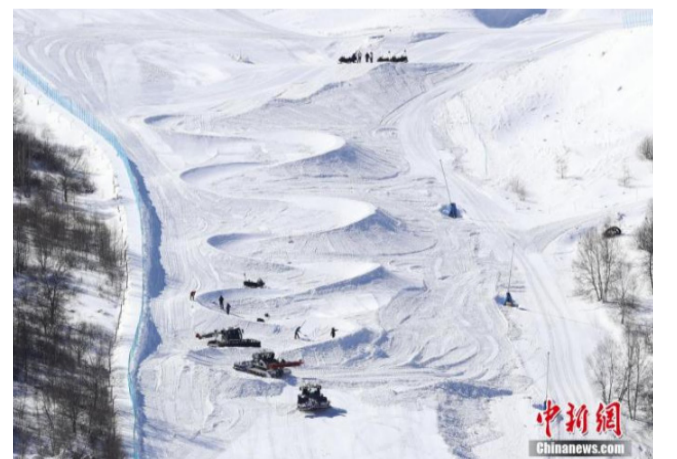
2月23日，北京冬奥会刚刚落下帷幕，河北张家口赛区云顶场馆群迅速进入冬残奥会转换期，图为工作人员、机械设备在河北张家口赛区云顶滑雪公园进行赛道二次塑型作业。