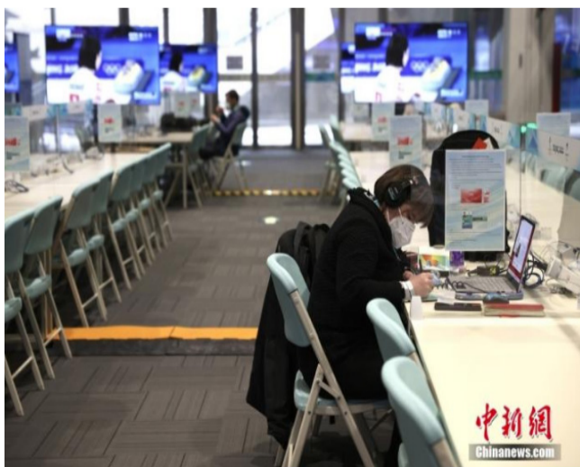
2月28日，北京冬残奥会主媒体中心在完成冬奥会到冬残奥会全部转换工作后，正式启动运行。

其中，针对残障运动员特点，国家冬季两项中心将对混合采访区雪面高度、坡道坡度进行调整，并降低围栏高度，以方便坐姿运动员接受采访。