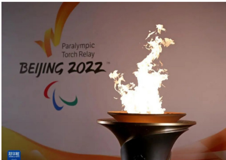
图为2月28日拍摄的点燃后的火种盆。

中新网北京3月1日电(王昊) 当地时间2月28日下午，北京2022年冬残奥会英国火种采集仪式在斯托克·曼德维尔体育场举行。