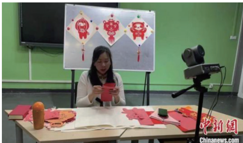
图为剪纸课程线上教学现场。

印尼特里莎克蒂旅游学院校长Fetty Asmaniati表示,参加此次活动能够增加学生对中国文化的洞察力和知识积累,让学生对学习汉语更有信心,希望学生用好所学知识,进一步促进印尼和中国文化交流。(完)