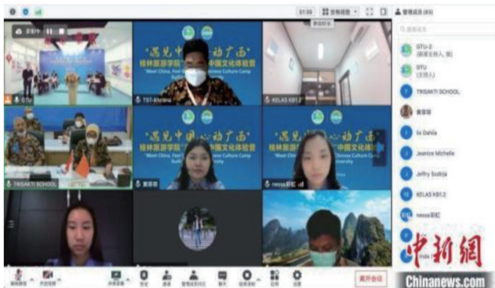
印尼特里莎克蒂旅游学院师生参加闭营仪式。