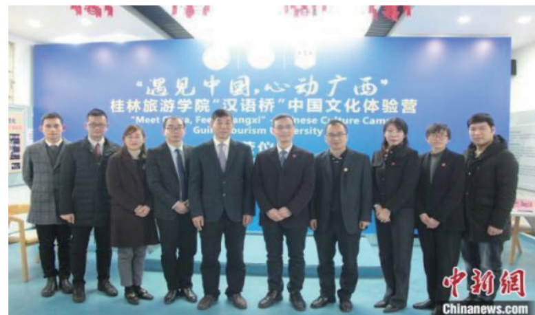
图为闭营仪式现场。