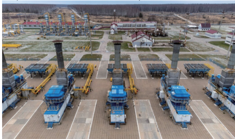
莫斯科东部卡西莫夫的地下储气库。俄罗斯供应欧洲近40%的天然气。