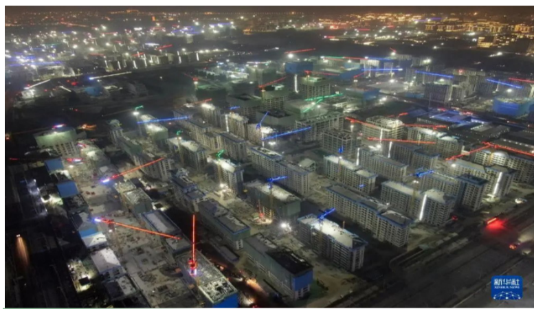
这是2022年1月4日拍摄的雄安新区容东片区华望城项目夜景(无人机照片)。