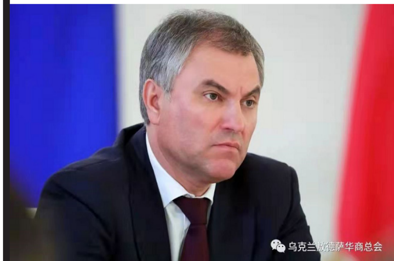
乌克兰敖德萨华商会