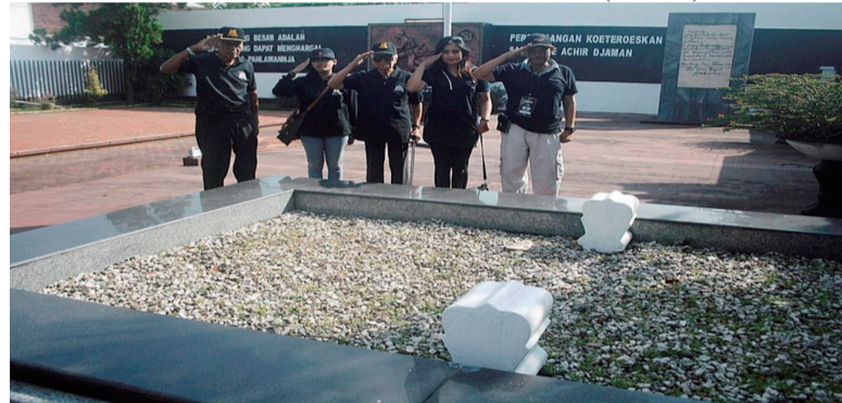
TRIP斗争 - 前TRIP战士和他们的家人, 星期五(30/7)向他们的同志们的坟墓表示敬意, 印尼学生军营(TRIP)的战士在1947年7月31日保卫独立战中牺牲。