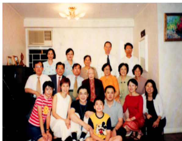
庆贺母亲九十寿辰全家大小合影