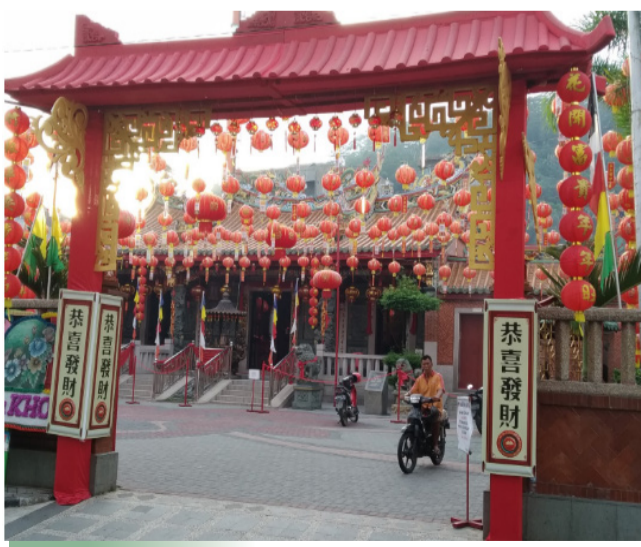
巴东市西兴宫新庙