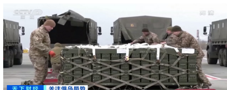
天下财经 关注俄乌局势