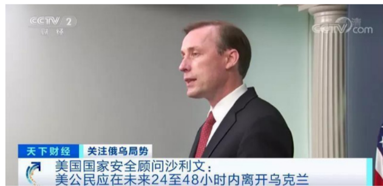
天下财经 关注俄乌局势