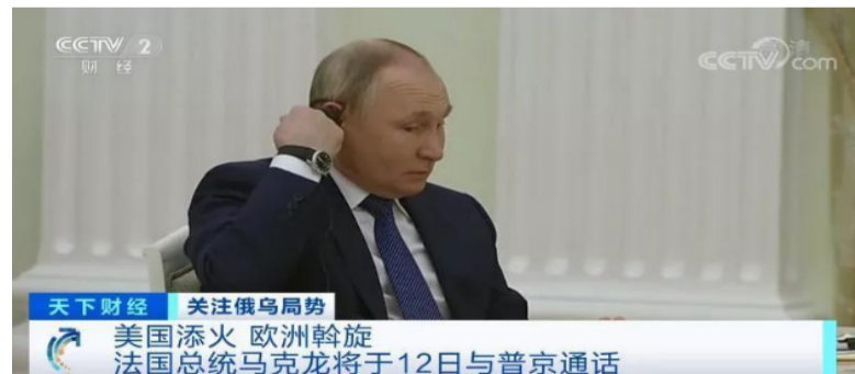
天下财经 关注俄乌局势