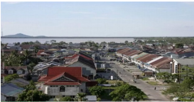
邦夏 (Pemangkat) 城区。

近两年,我又回到印尼,与乡亲交谈中发现邦夏话融入更多印尼话的同时,问学童几点上课竟听不懂“上课”这个词,随同去的儿子与亲友的下代虽用邦夏话沟通,但不时要问我等老头子“他讲什么?”在椰城还发现,年青人对婚丧送礼金和帛金通称送红包,甚至我辈将会标及挽联都说成“横彩”,令人哭笑不得!当前华文解禁,恢复和普及华文教育应是印华社会的当务之急。