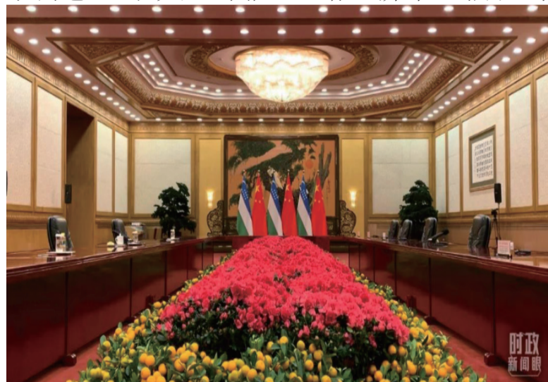
△中国与乌兹别克斯坦两国元首会谈开始前的现场。 (总台央视记者段德文拍摄)