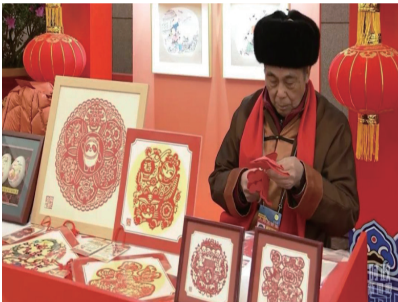
△剪纸技艺展示。