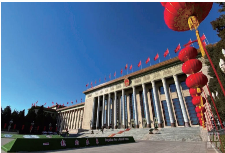
△人民大会堂外，为迎接冬奥新设计的“一起向未来”字样格外醒目。