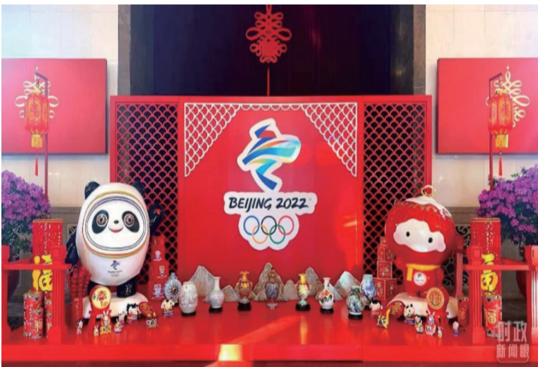
△北京冬奥会、冬残奥会吉祥物亮相大会堂。