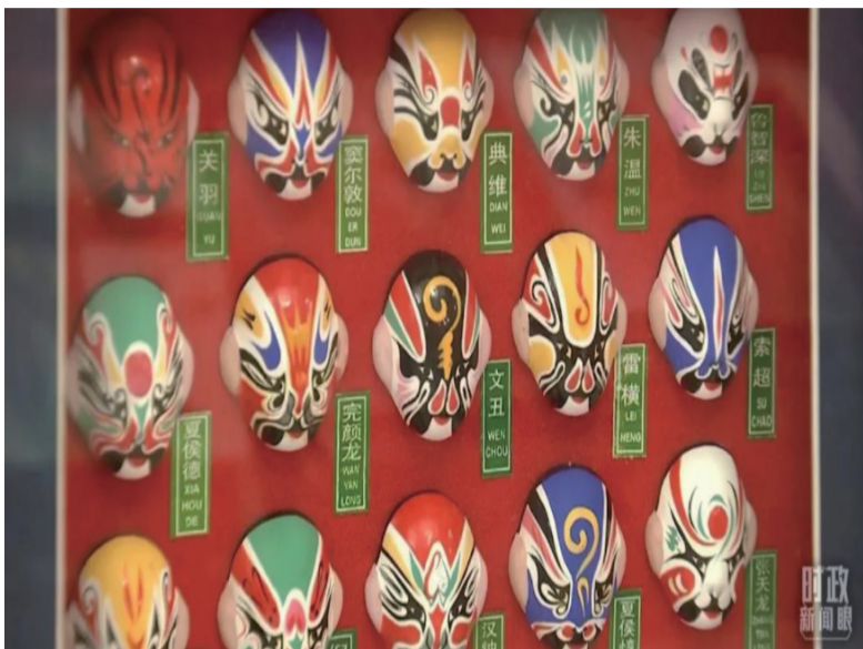
△京剧脸谱展示。