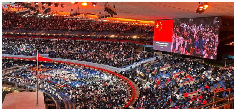
北京冬奥会开幕式现场