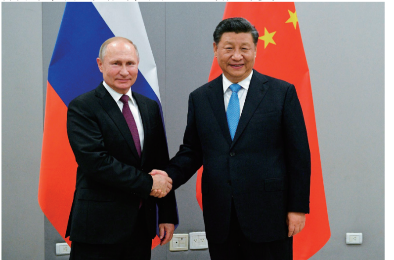
资料图：2021年9月16日，俄罗斯外长拉夫罗夫表示，俄罗斯总统普京接受中方邀请，将于2022年2月出席北京冬奥会。

的参与下，从去年开始在中国核电站新建四台发电机组。所有这些都极大地加强了中国和整个亚洲地区的能源安全。”