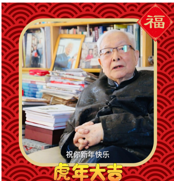
图为96岁的大陆新闻学泰斗方汉奇向台湾98岁的新闻学大家李瞻拜年的视频截图。