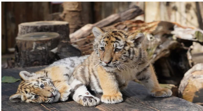
1月29日在云南野生动物园狮虎山庄拍摄的东北虎小姐妹。

新华社北京1月30日电 提到老虎，你会想到什么？一只毛色绮丽、体态威武、头顶“王”字的大猫？你知道世界上有多少种老虎吗？老虎真的不会爬树吗？在野外遇到老虎又该怎么办？让我们一起来了解下这个神奇的物种。