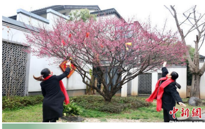
市民抛福袋、许心愿