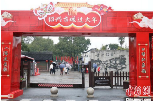
大年初一的鲁迅故里