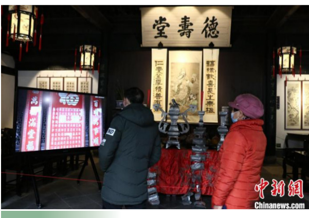
游人参观“云”祝福仪式