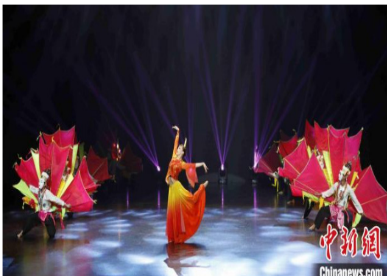
图为傣族舞蹈串烧《凤凰飞天》。