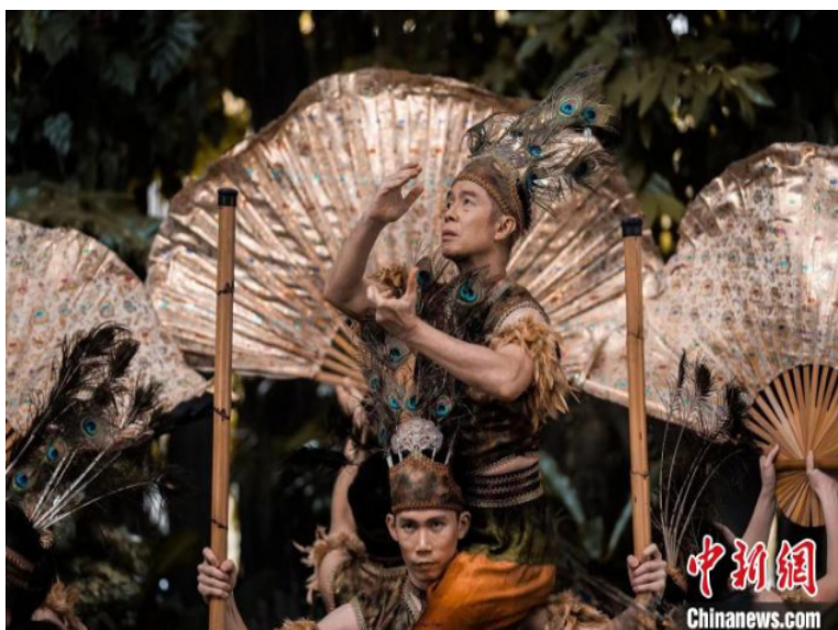
图为马来西亚舞蹈《脉动雨林》。