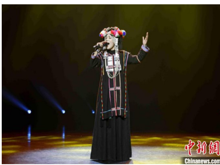
图为哈尼族歌曲《摇篮曲》。