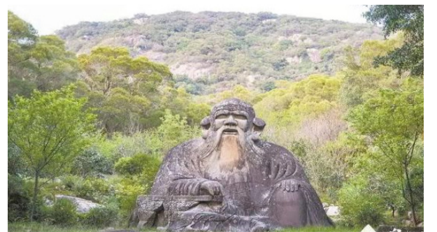
老君岩造像坐北朝南，背屏青山。