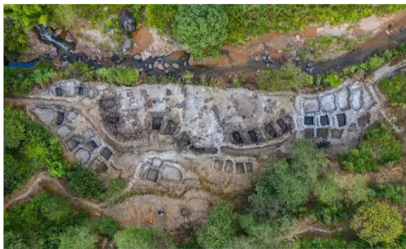
尾林窑址遗迹

产价值研究，办法还鼓励通过合作、科研立项、政府购买服务等方式，征集整理史料文献、开展专题调研，加强对外交流合作，发挥遗产的文化标识作用。同时，制定泉州世界遗产校园教育传承方案，把遗