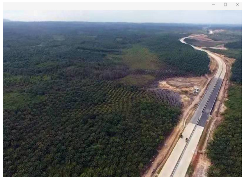
库台卡特内加拉(Kutai Kartanegara)地区航拍。