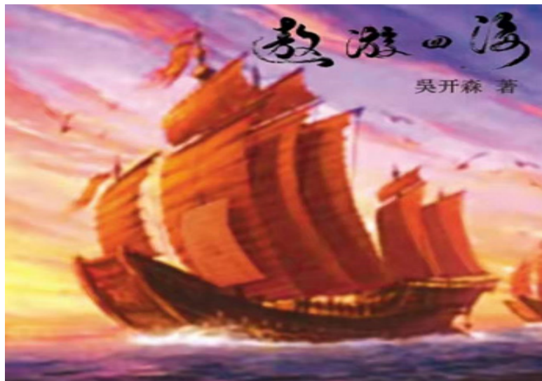
《遨遊四海》新书封面