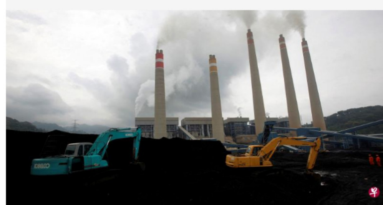
印尼是全球最大动力煤出口国, 煤炭出口禁令导致依赖印尼煤炭的亚洲经济体叫苦连天。