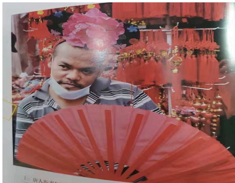
摄影佳作:雅加达唐人街卖年货的小贩，一名网红民间人物。