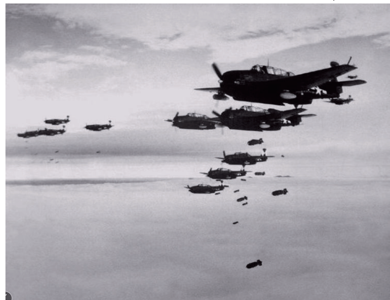
狂轰滥炸坤甸的日本九架零式飞机