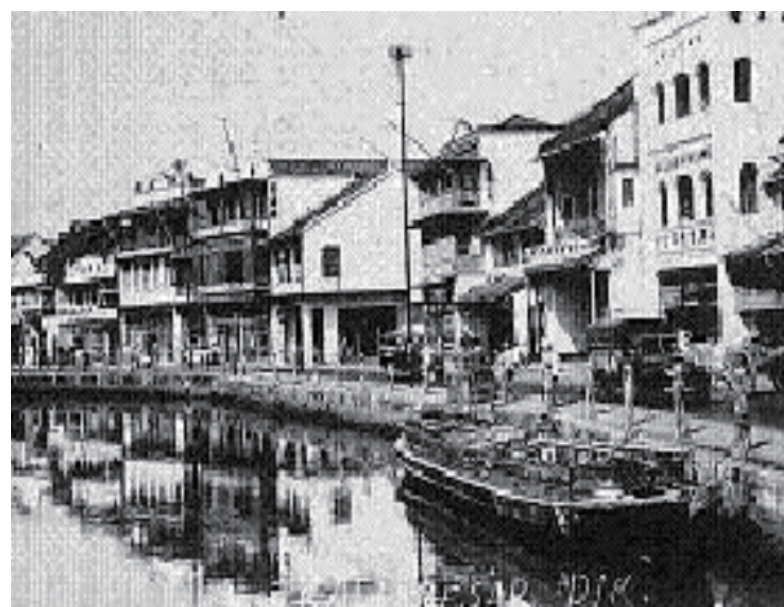
上图为坤甸老埠头华人商业区一角——大沟沿的店铺。

图为日本投降后，西加里曼丹华侨建于东万律机场附近“万人坑”的“抗日战争时期遇难同胞和烈士纪念碑”。二战期间，惨遭日本飞机轰炸及日本占领军屠杀、活埋、劳役致死的华、印、荷各族人民达2.1万人，其中华人、华侨超过5000人。血海深仇，永世难忘。（注：苏哈托上台后，将此塔拆毁，另建纪念园）。