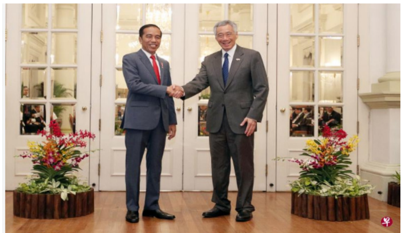
新印领导人上一次非正式峰会, 于 2019 年 10 月在我国召开。李显龙总理 (右) 将在 1 月 25 日访问印度尼西亚民丹岛, 参加由印尼总统佐科 (左) 主持的新加坡-印尼领导人非正式峰会。(档案照)