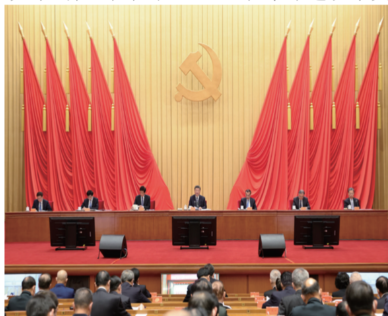
1月18日，习近平在十九届中央纪委六次全会上发表重要讲话。李克强、栗战书、汪洋、王沪宁、赵乐际、韩正出席会议。