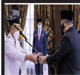
东南苏拉威西省省长Ali Mazi在他的就职典礼。

（本报讯）在2024年大选（选举）之前，内政部（Kemendagri）有一项重要的家庭作业，即在2022年挑选出101名省、县、市长取代任期已满的地方长官；在2023年又要挑选170名省、县和市长取代任期已满的地方首长。总共有271个代理首长，因此，内政部目前正在起草一项政府条例（PP）来确定挑选地方长官的标准。