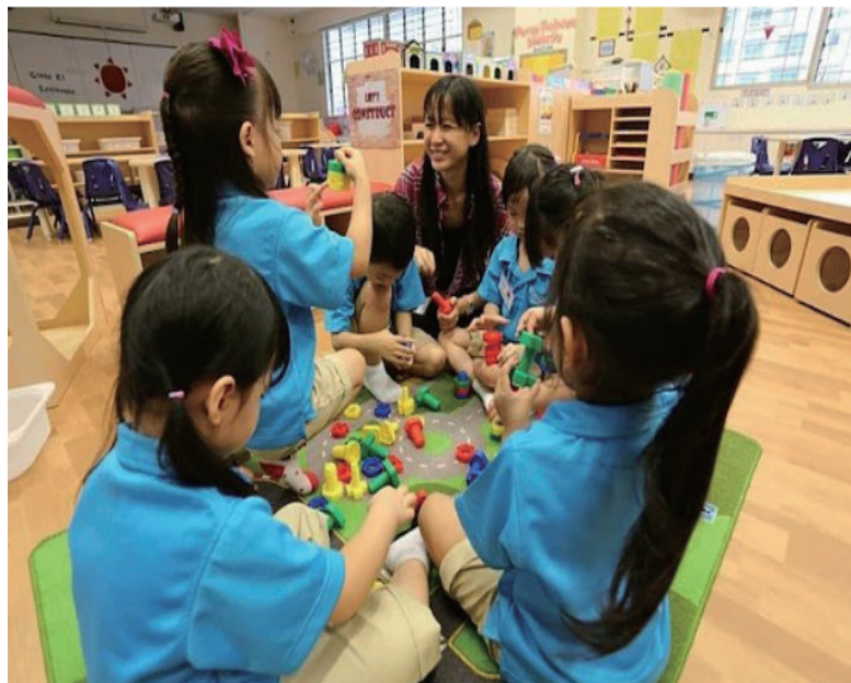
新加坡托育机构里的老师和孩子