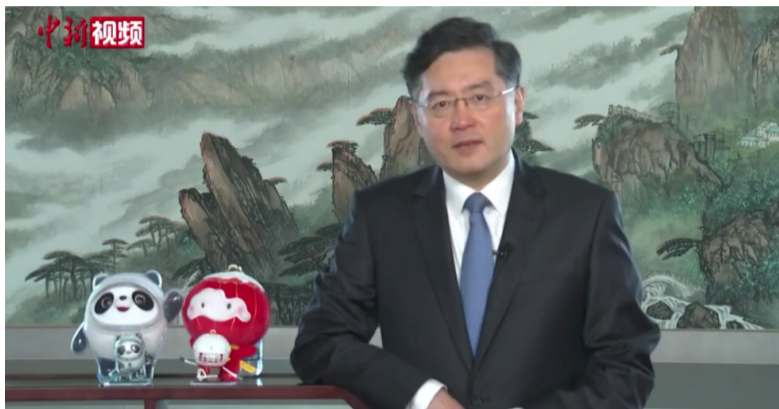
中国驻美大使秦刚：期待中美冰球队北京冬奥会精彩表现

中新网1月12日电 据中国驻美国大使馆网站11日消息，美东时间1月10日晚，秦刚大使在美国国家冰球联盟(NHL)总冠军球队华盛顿首都队主场和波士顿棕熊队比赛期间发表视频致辞，介绍北京冬奥会筹备情况，期待中美冰球队呈现精彩赛事。