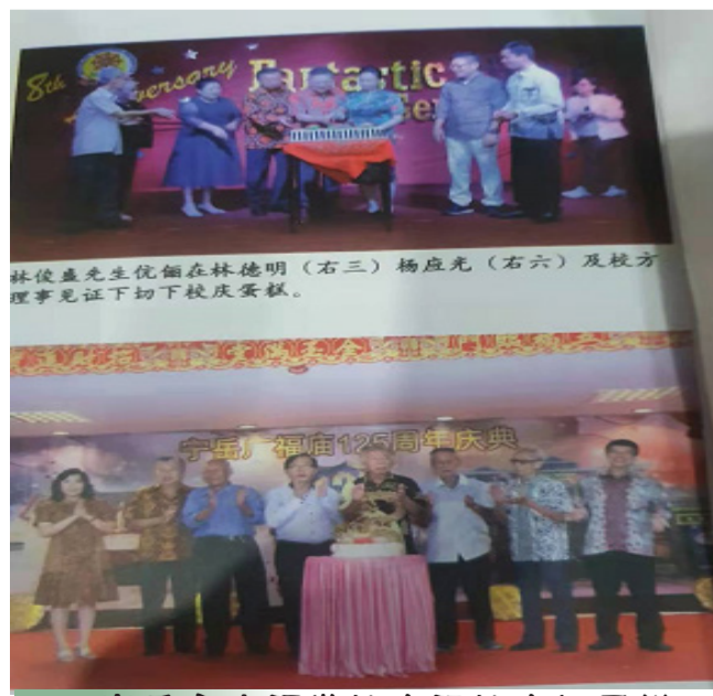
宁岳市广福学校庆祝校庆切蛋糕。