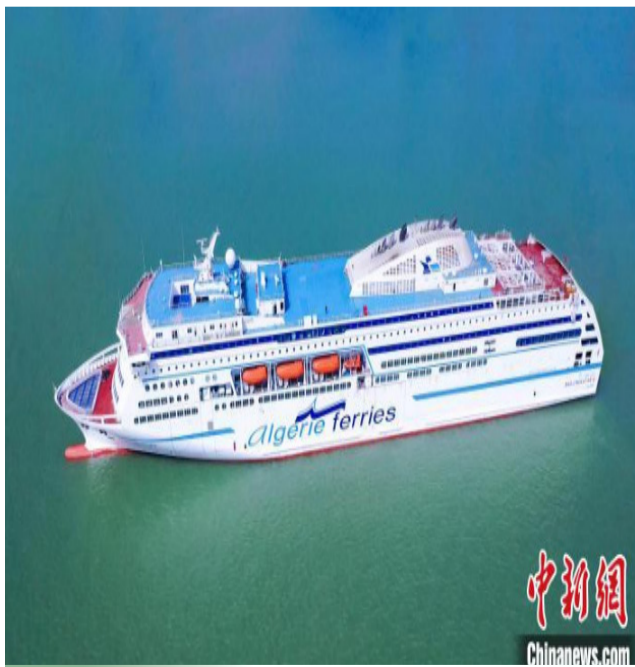
豪华客滚船