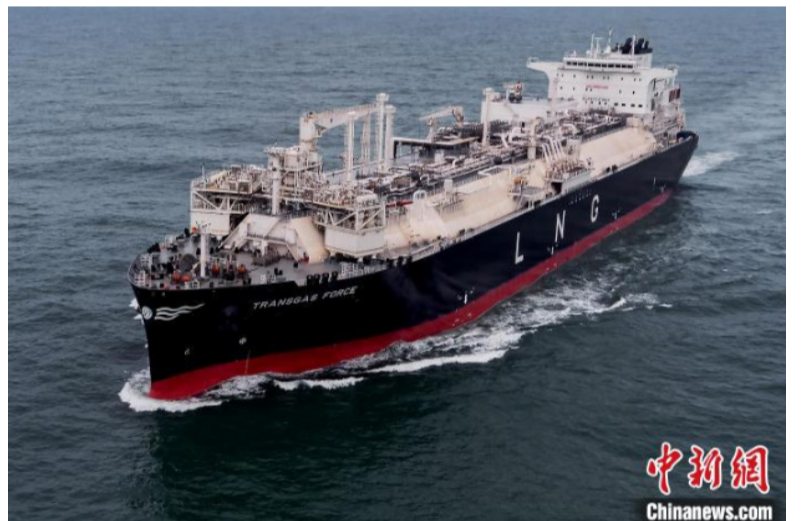
大型浮式液化天然气存储及再气化装置 (LNG-FSRU)