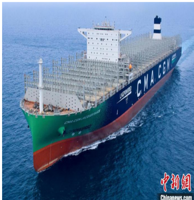
23000TEU双燃料动力集装箱船