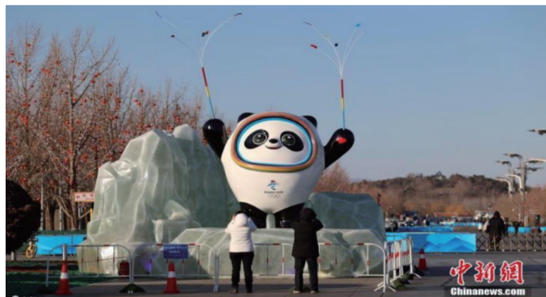
1月10日，2022年北京冬奥会吉祥物“冰墩墩”和冬残奥会吉祥物“雪容融”亮相奥林匹克公园，吸引众多游人合影留念。