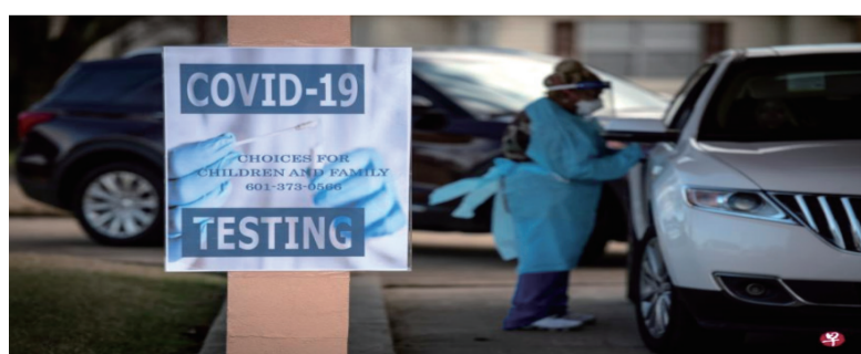
美国1月10日通报新增冠病确诊病例135万起，再次打破全球最高单日纪录；此前的纪录为美国在1月3日创下的103万起。

美国多州的卫生体系已不堪重负并进入危机模式，仅接收病情严重的患者等措施，希望能最大限度地利用有限的医疗资源。