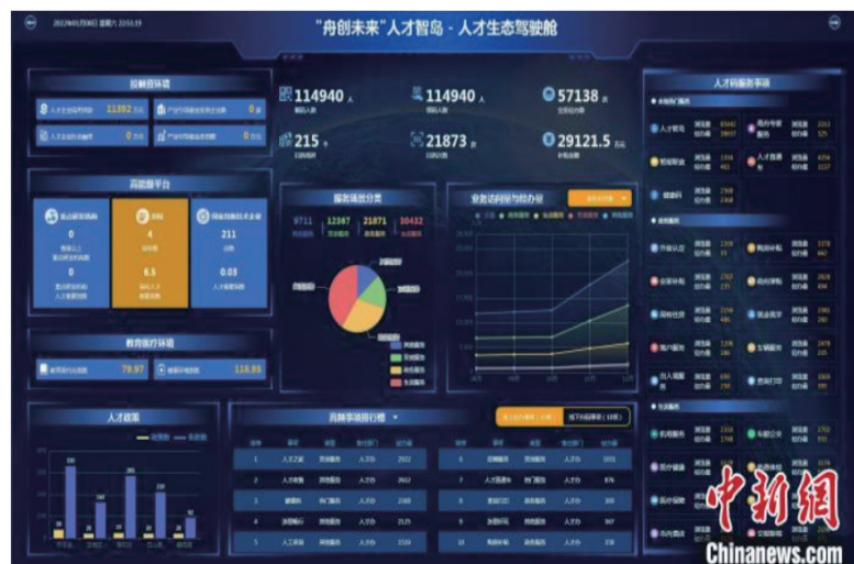
“舟创未来”人才智岛。