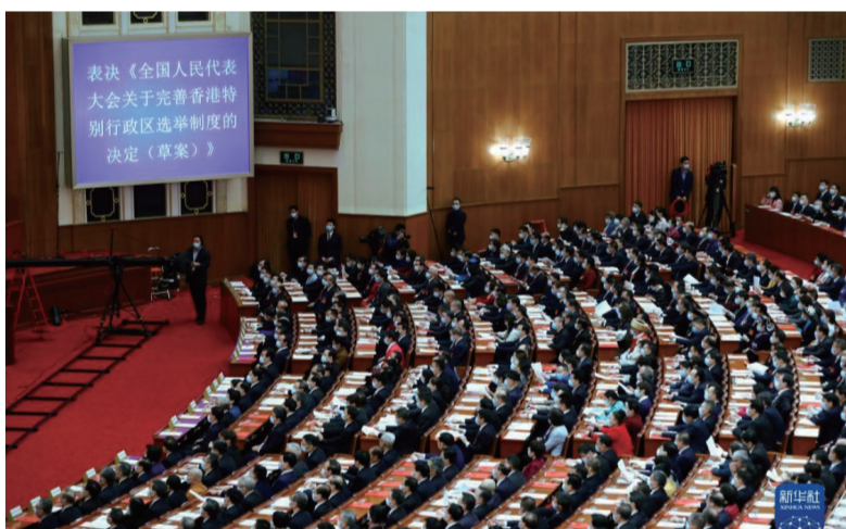
2021年3月11日，十三届全国人大四次会议表决通过《全国人民代表大会关于完善香港特别行政区选举制度的决定》。这是表决现场。