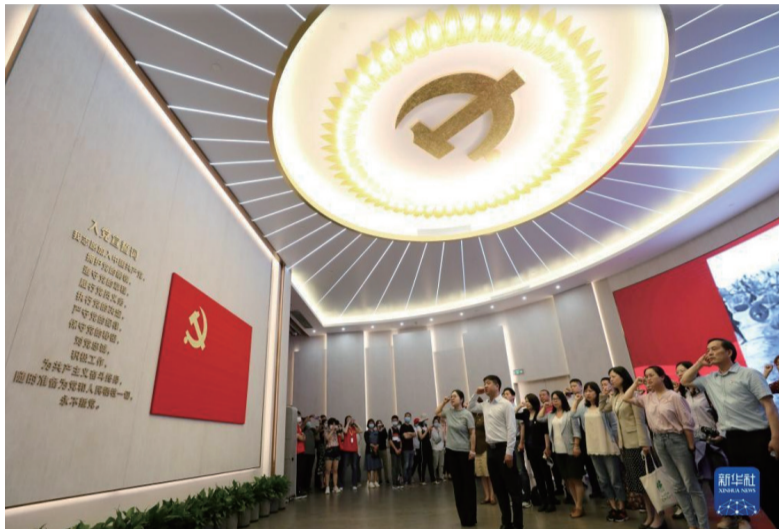
这是2021年6月3日，党员在全新开馆的上海中共一大纪念馆里重温入党誓词。