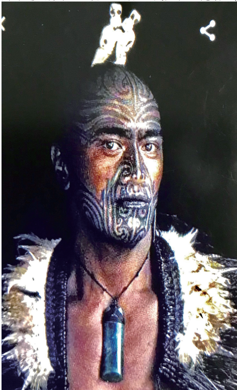
纹面的新西兰毛利族人