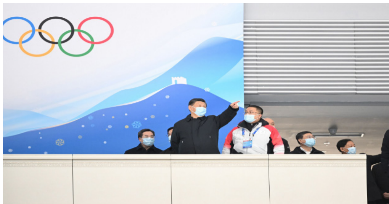
1月4日，中共中央总书记、国家主席、中央军委主席习近平在国家速滑馆主席台区察看场馆内部布置及赛道情况。